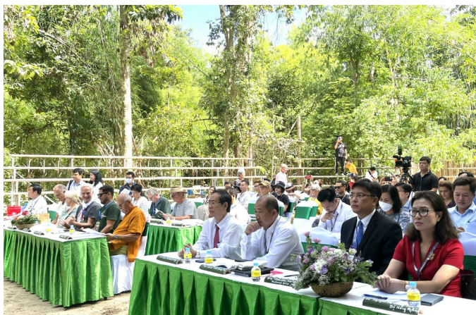
Các đại biểu tham dự lễ khai mạc hội thảo.