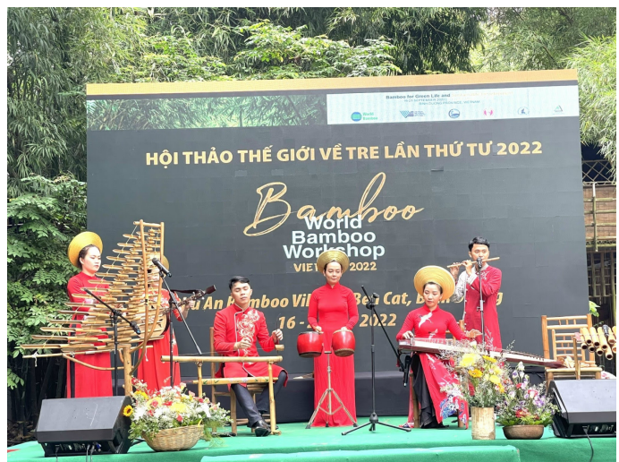
Một tiết mục văn nghệ đậm đà bản sắc dân tộc biểu diễn tại hội thảo.

Tại hội thảo, các chuyên gia hàng đầu của Việt Nam và thế giới sẽ trình bày các báo cáo chuyên đề liên quan đến cây tre, như: Giới thiệu các loại giống tre từ kinh nghiệm của thế giới; sản xuất các sản phẩm thủ công mỹ nghệ từ tre bằng kỹ thuật tiên tiến; vai trò và ứng dụng của cây tre trong trồng đời sống của các địa phương bằng cây tre để giảm phát thải khí nhà kính; các loại vật liệu mới, tiên tiến từ tre và sợi tre trong tiến trình thay t