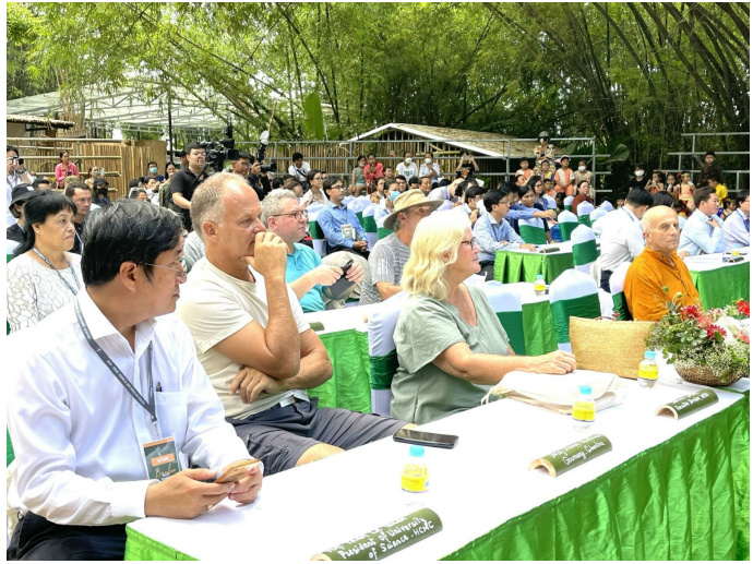
Hội thảo thu hút nhiều chuyên gia, nhà nghiên cứu trên thế giới tham gia.